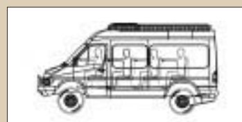
5 door Hardtop Van