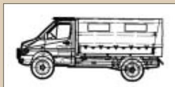
Troop and Cargo Transporter