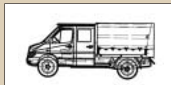
Double Cab with Workshop Body