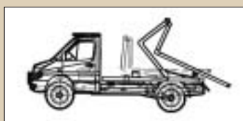
Load Handling System PLS

Reinigungsfreundliche Seiten- und Deckenverkleidung Easy-clean side and roof lining