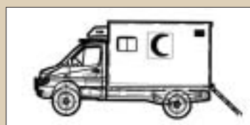
Ambulance Shelter Carrier